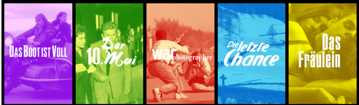
Figure : conception du visuel « filmo »

Grâce au branding, l'édition est identifiable en tant que collection. Chaque titre de film est retravaillé typographiquement pour filmo et doté d'un nouveau visuel (poster). De surcroît, un jeu de couleurs a été développé et attire le regard par les éléments graphiques.